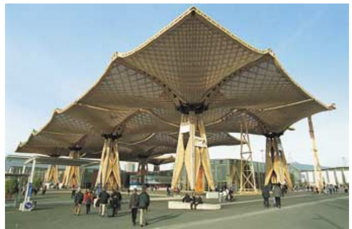
Holzdach am EXPO-See