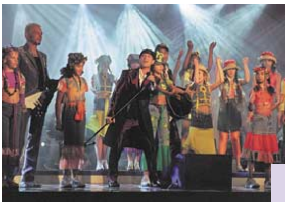
Auftritt der Scorpions bei der Eröffnungsgala am 1. Juni 2000

Die Veranstaltungen sind kostenpflichtig. Nähere Infos und Tickets unter Tel. 0-2000.