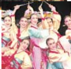
Beitrag zum Nationentag Korea