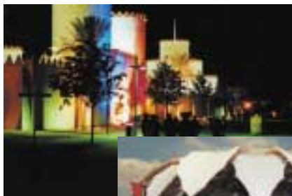
Nationenpavillon Vereinigte Arabische Emirate