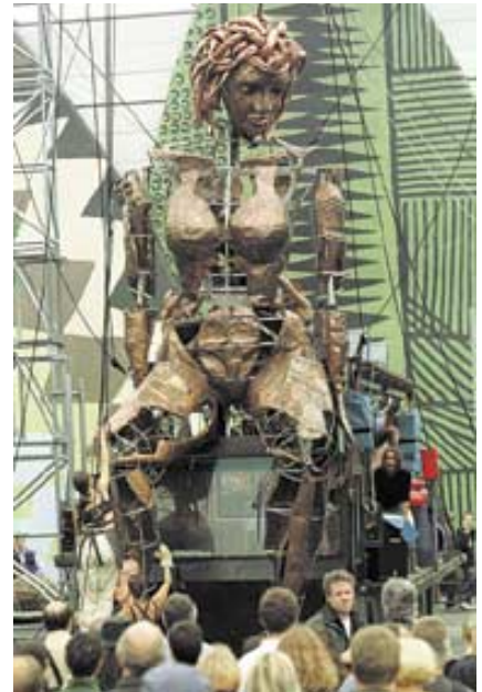
Die tägliche Parade auf dem EXPO-Gelände

Bekannte Stars und interessante Newcomer, Live-Erlebnis und internationales Programm prägen das einmalige Flair der Weltausstellung im Jahr 2000.