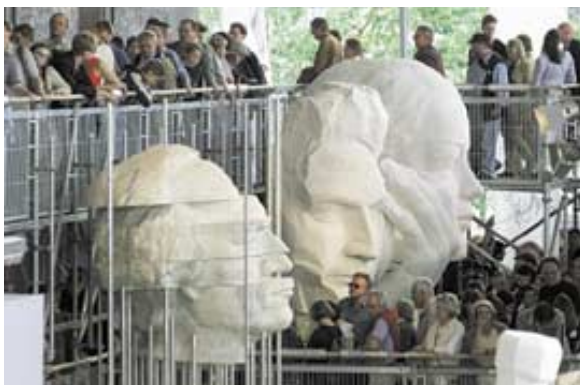
Pre-Show im Deutschen Pavillon

Die sechzehn Bundesländer stellen sich im Deutschen Pavillon in einem „KulturMobile“ mit ausgewählten kulturellen Beiträgen vor.