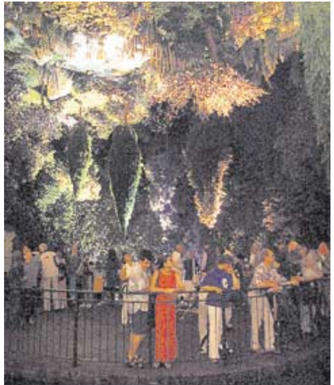
Themenpark: Planet of Visions

Der Themenpark bietet auf 100.000 m 2 und in 11 Ausstellungswelten Zukunft zum Anfassen und Staunen. Reisen Sie zum Beispiel rückwärts durch die Zeit, erleben Sie, wie aus Mythen und Geschichte Zukunft entsteht. Sehen Sie bahnbrechende Technologien und kühne Visionen, die vielleicht schon bald zu unserem Alltag gehören werden. Verlassen Sie festen Boden und tauchen Sie ein in eine atemberaubende Unterwasserwelt, lassen Sie sich von einem Schwarm interaktiver Roboter begleiten, fahren Sie 1.000 Meter unter die Erdoberfläche oder erholen Sie sich einfach am Strand – 1.000 und ein Erlebnis warten auf Sie.