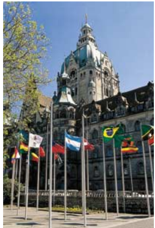
Hannover: Neues Rathaus

Die Städte und Gemeinden helfen den Vereinen und Verbänden bei der Organisation des EXPO-Besuches: Sie informieren z.B. über lokale und regionale Ansprechpartner (Reise-